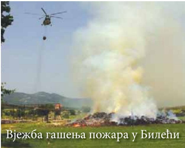
Вјежба гашења пожара у Билећи

На заједничкој вјежби гашења пожара одржаној 11. 06. 2010. године у Билећи, која је била у организацији 4. пјешадијске бригаде ОС БиХ, поред припадника бригаде учествовале су и јединице бригаде ВС и ПВО ОС БиХ, као и јединице ватрогасних друштава општина Билећа и Требиње. Припадници 1. хеликоптерског сквадрона из Бања Луке учествовали су са два хеликоптера М1-8Т са задатком гашења пожара противпожарним ведром ППВ-2000, као и једним хеликоптером типа SA-342 „Gazela“ са задатком извиђања рејона пожаришта и медицинске евакуације. На тактичко-техничком збору, одржаном непосредно прије вјежбе гашења пожара, припадницима војно дипломатског кора страних земаља, као и представницима Министарства одбране БиХ и Оперативне команде ОС БиХ, приказане су тактичко-техничке могућности хеликоптера М1-8 и SA-342 „Gazela“ при гашењу пожара и медицинској евакуацији.